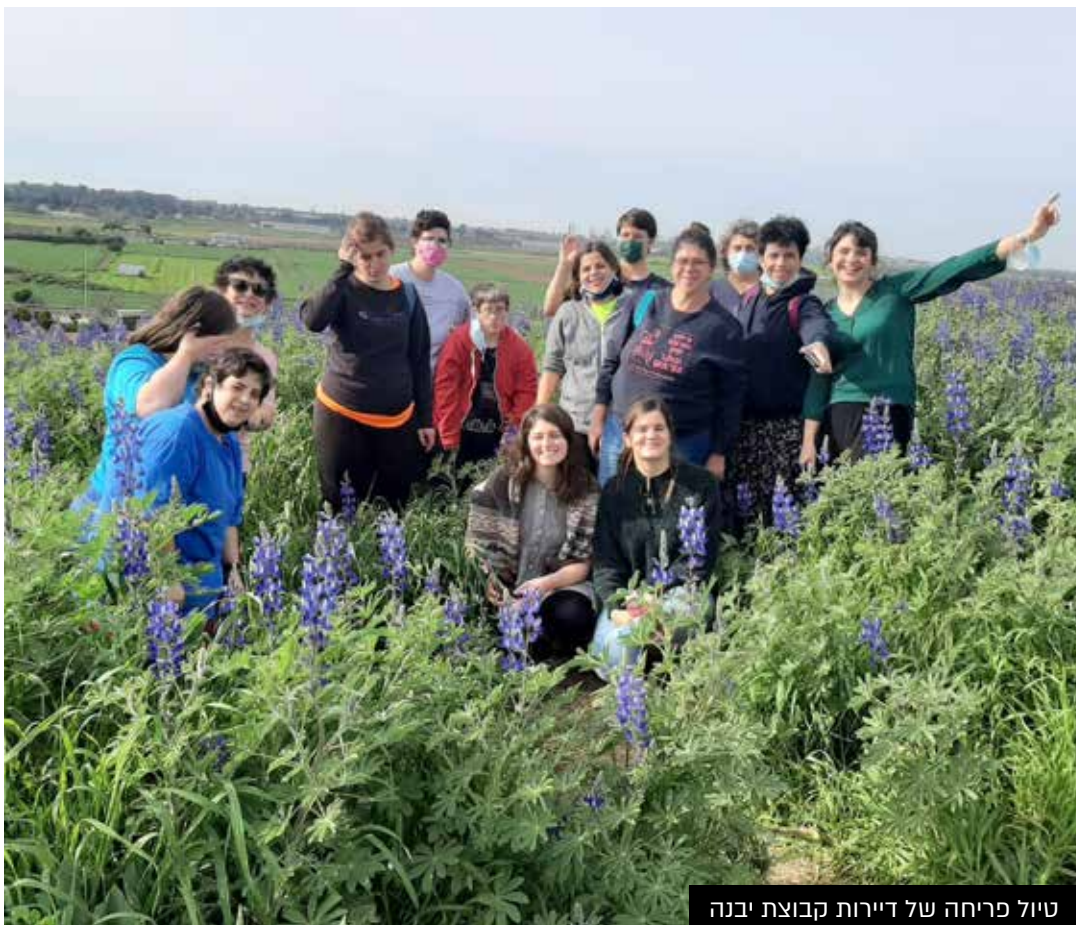
טיול פריחה של דיירות קבוצת יבנה

שק"ל במרחב הפתוח - מרכז יום טיפולי לאנשים על הרצף האוטטיסטי בתפקוד נמוך בחוות סוסים בכפר שמואל. במרכז כ- 20 מועסקים והוא פעל ללא הפסקה באישור משרד הרווחה. השתדלנו שהפעילויות תתקיימנה בחוץ, למעט ימי מזג אוויר סוער. הצלחנו במאמץ גדול ללמד את רוב המועסקים לחבוש מסכה ולשמור על היגיינה. הצוות הקפיד על שמירת ההנחיות. מתנדבים הפסיקו לבוא ורק לאחרונה חזרו הסטודנטים לעבודה סוציאלית. בכפר שמואל היו שתי תקופות בידוד, הראשונה בגלל מועסק חולה והשנייה בגלל מורה למוסיקה חולה. התקופות האלו היו קשות מאוד למשפחות. הצוות שמר על קשר עם המועסקים והמשפחות בפגישות זום. אפשרנו למשפחות לקבל הדרכה מצוות מקצועי של שק"ל. השארנו במאמץ רב את המסגרת פתוחה גם כשחלק מהצוות היה בבידוד.