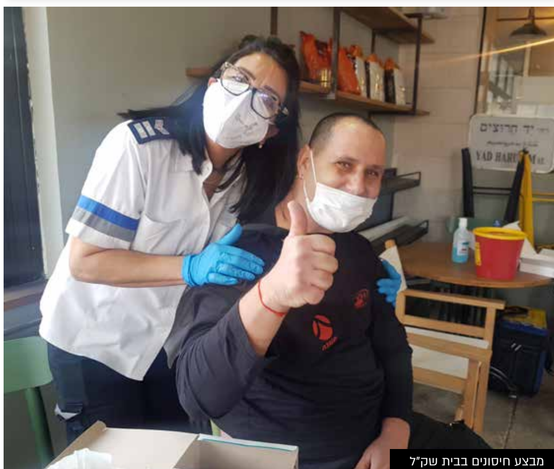
מבצע חיסונים בבית שק"ל