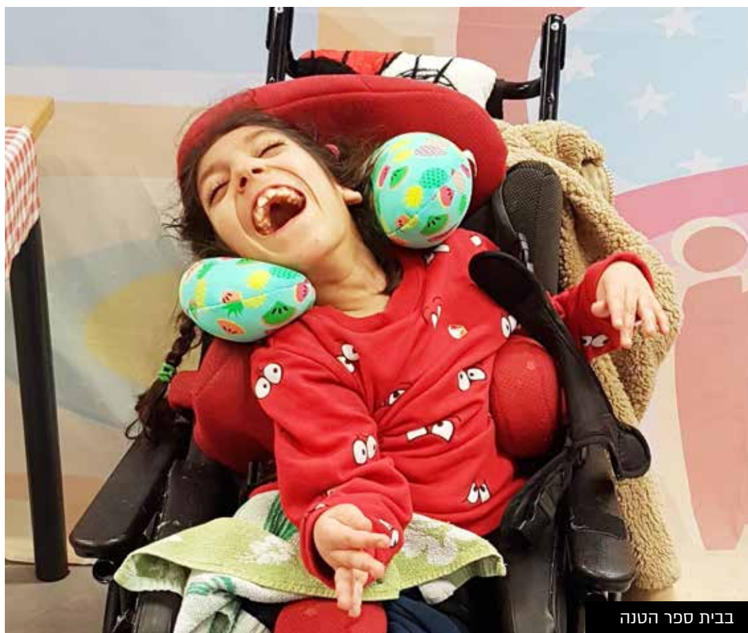
בבית ספר הטנה