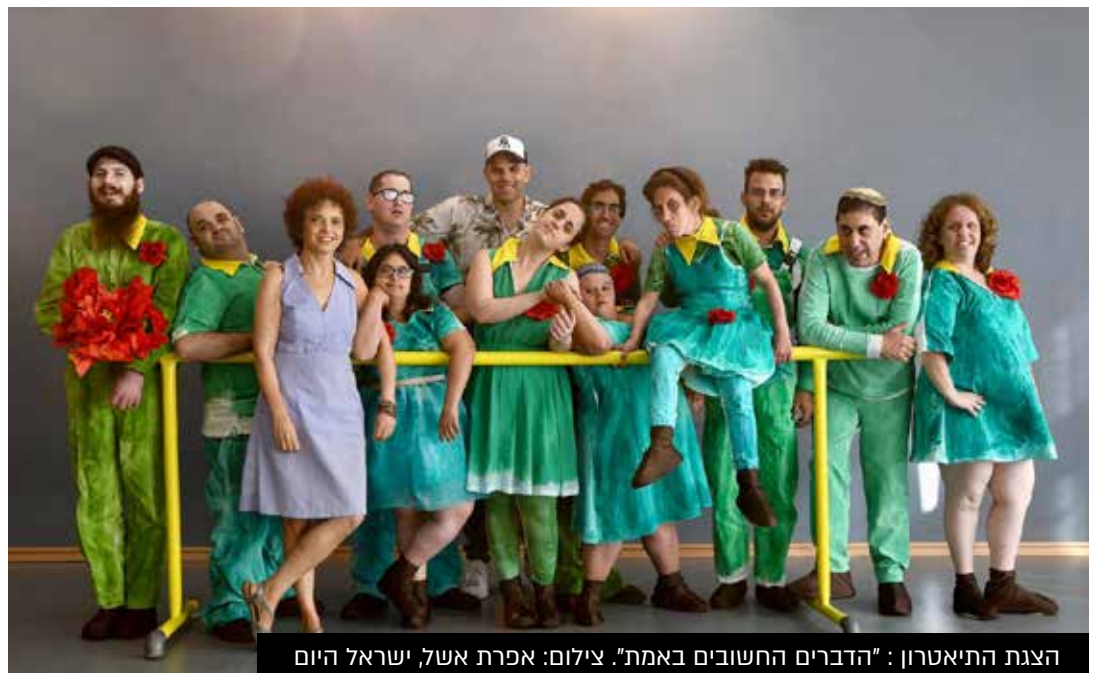
הצגת התיאטרון: "הדברים החשובים באמת".

פתיחת מחזור ב' התעכבה אף היא בעקבות מגפת הקורונה, אך בחודש ספטמבר 2020 הוחלט לפתוח את התוכנית. למחזור ב' נבחרו 12 מועמדים המוגדרים "משוקמים" ומשך ההכשרה קוצר משלוש שנים לשנתיים. כל המשתתפים קבלו חיסון ופעלו בהתאם להוראות משרד התרבות במסגרת התו הסגול. לאחר ימים מעטים של פעילות, נכנסנו לסגר נוסף ולכן הוחלט להעביר את השעורים ב"זום" עם ליווי אישי לכל אחד מהמשתתפים. תחילה היה למשתתפים קשה להשתלב שלושה בקרים בשבוע בפעילות דרך המחשב, אך עם חלוף הזמן כולם התרגלו ואף הצליחו ליהנות מהלימודים, מהחברותא על המסך ומהפנמת חומרי הלימוד. ככל שהתאפשר, חזרנו לפעילות במתכונת רגילה בסטודיו. במקביל, כדי להקל על המשתתפים, הוחלט שבימי גשם נמשיך בלימודי "זום", גם אם ניתן לקיים לימודים בסטודיו.