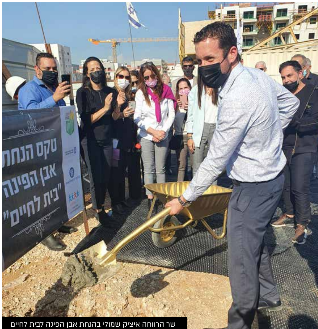
שר הרווחה איציק שמולי בהנחת אבן הפינה לבית לחיים