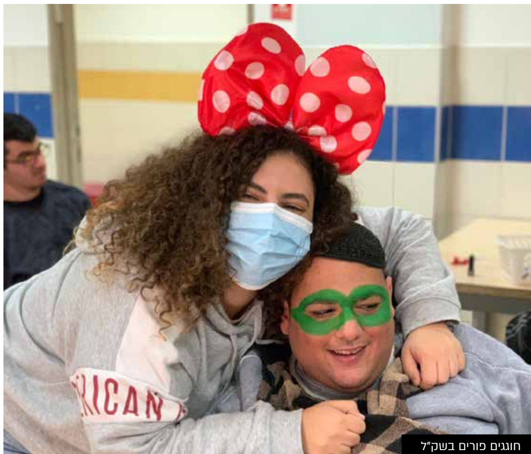
חוגים פורים בשק"ל