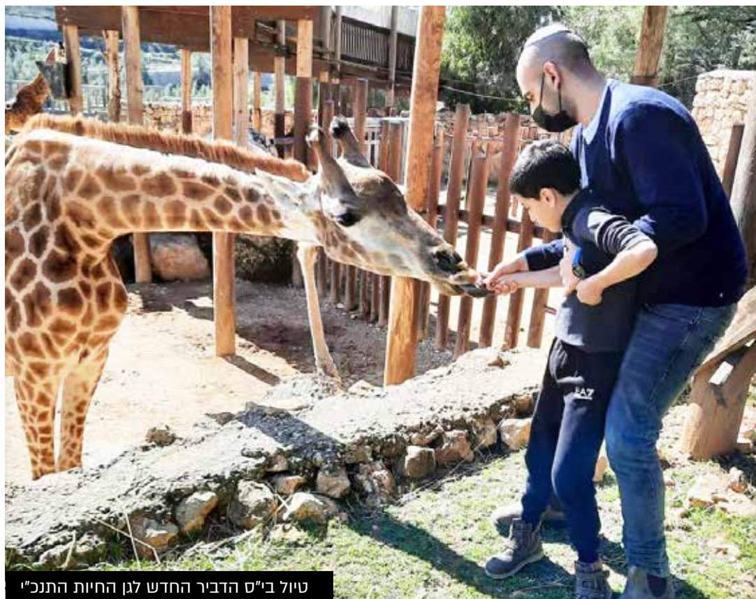
טיול ב"ס הדביר החדש לגן החיות התנכ"י