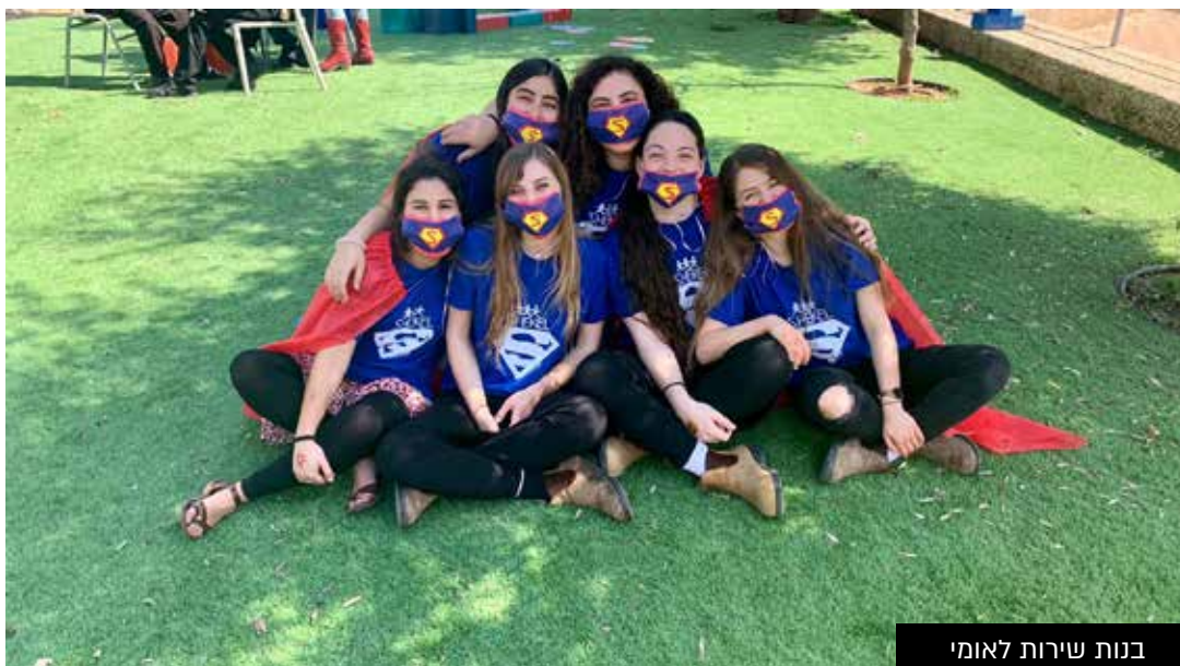
בנות שירות לאומי