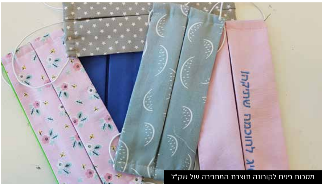
מסכות פנים לקורונה תוצרת המתכרה של שק"ל