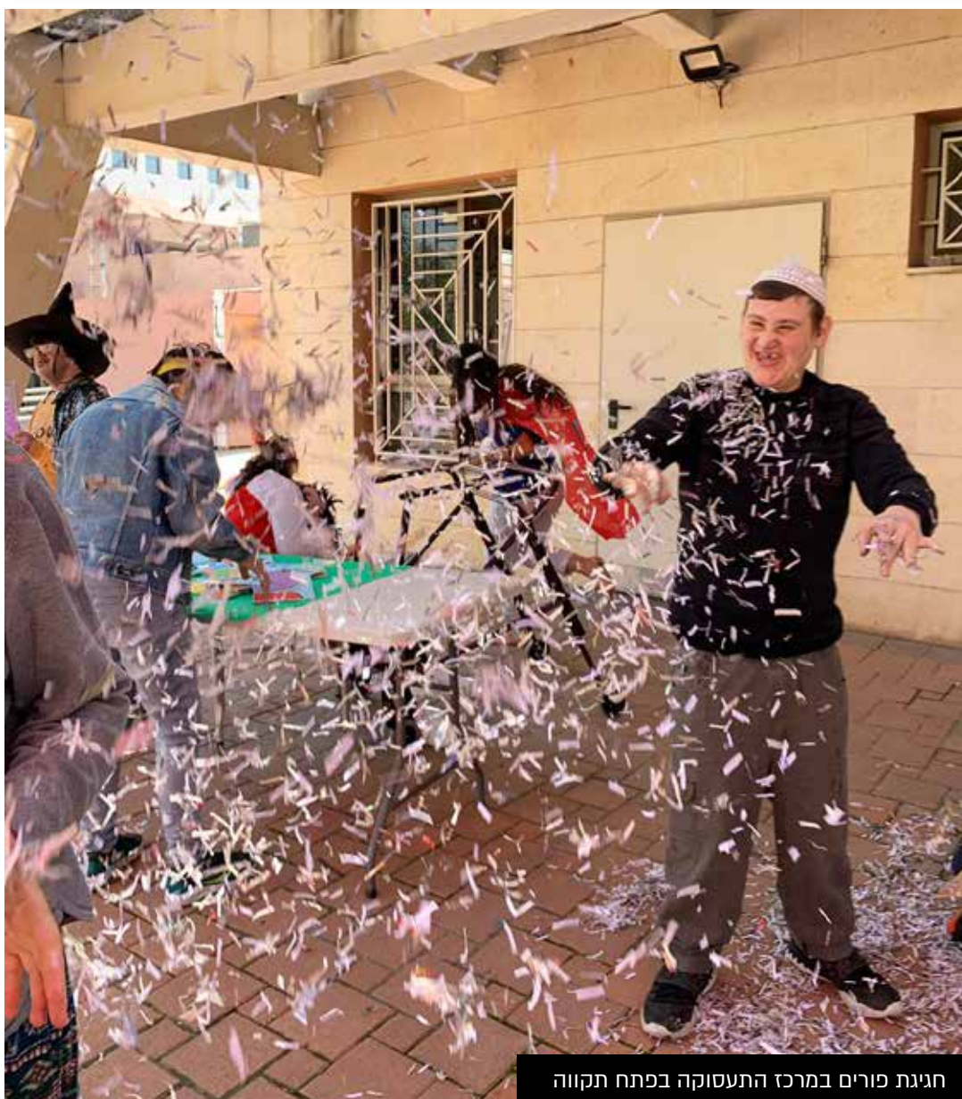
חגיגת פורים במרכז התעסוקה בפתח תקווה