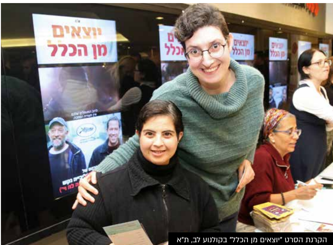
הקרנת הסרט "יוצאים מן הכלל" בקולנוע לב, ת"א

הפעילות ברשתות חברתיות זוכה לתהודה ציבורית רחבה ובזכותה להשתתפות פעילה ביוזמות של שק"ל. מספר מעגלי "עיגול לטובה" למען שק"ל המשיך לעלות ובהתאם סכום התרומה החודשי גדל ועמו התודעה הציבורית. כמו כן, בזכות עיגול לטובה קבלנו מענק חירום לקורונה מקרן וינברג . במהלך השנה היו פרסומים רבים בהם היה ייצוג של שק"ל בעיתונות הארצית והמקומית וכן בטלוויזיה, כגון: סדרת כתבות בנושא אוטיזם בתפקוד גבוה בחדשות "כאן".