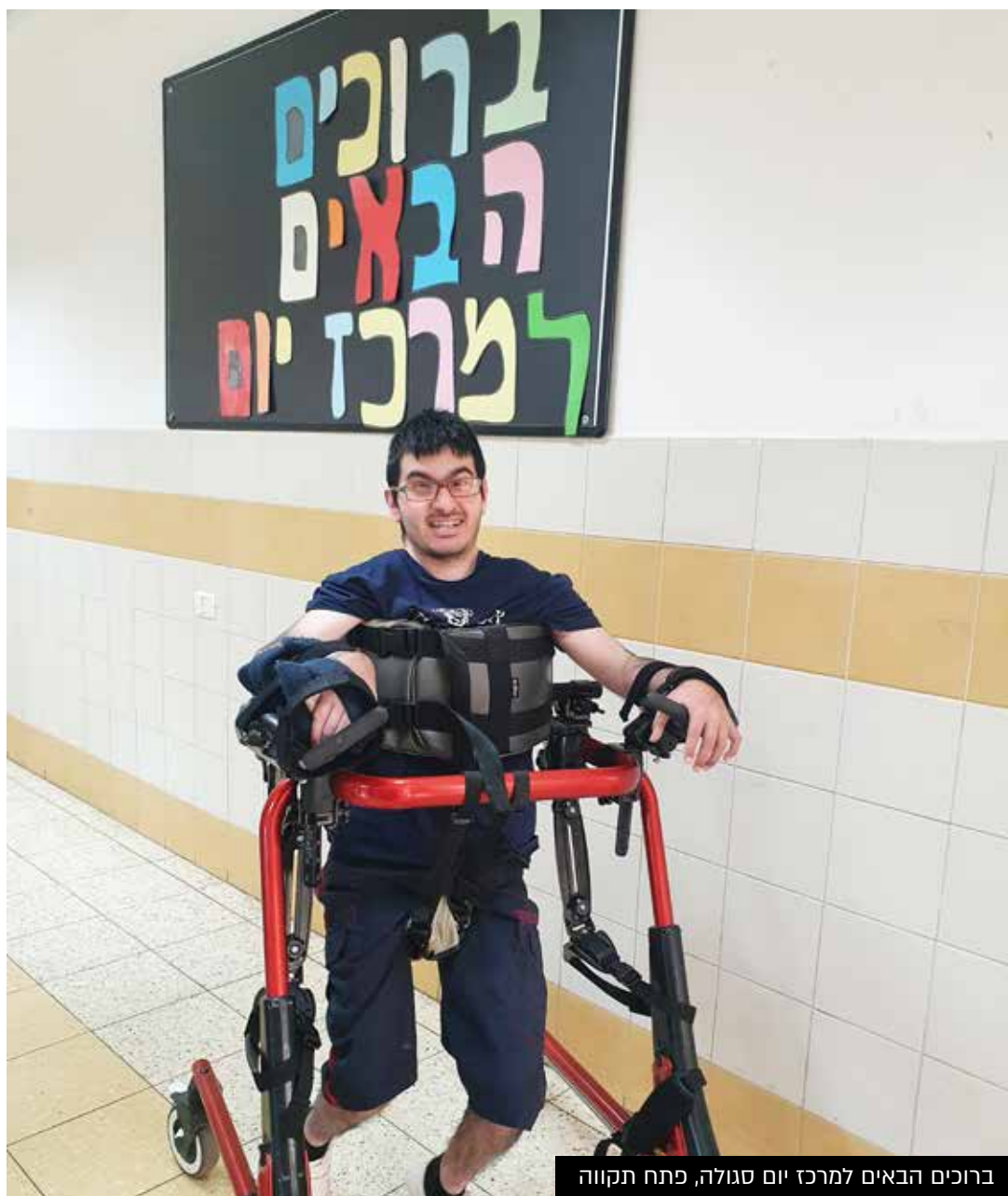
ברוכים הבאים למרכז יום סגולה, פתח תקווה