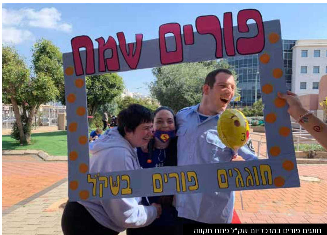
חוגגים פורים במרכז יום שק"ל פתח תקווה